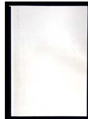
Pagina interna della bozza originale